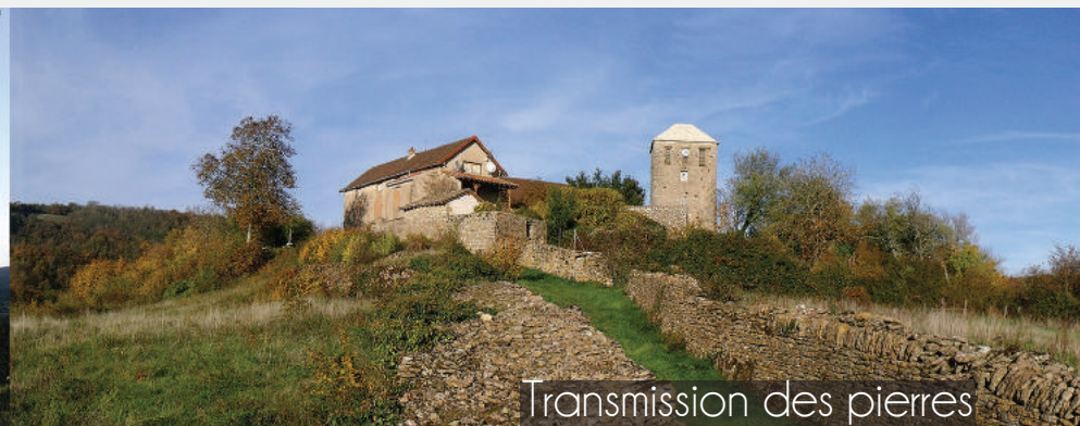
Transmission des pierres