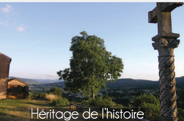
Héritage de l'histoire

Le Repentir prend sa source au hameau du Venay dans le vallon à l'est du promontoire rocheux de l'Eglise de Château. Sa vallée dominée par le mont Grenoi au nord (555 m), s'étend entre les chainons granitiques couverts par la forêt des trois Monts à l'ouest et les reliefs calcaires d'En Roche et Chaumont à l'est. Il s'écoule au sud-est jusqu'à la vallée de la grosne dont il est l'affluent au pied du village de Sainte Cécile