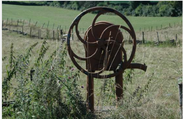
réalisé par nos soins : ne pas jeter sur la voie publique

Rénovation de la salle du premier étage de la tour par les bénévoles de l'Amicale de Château.