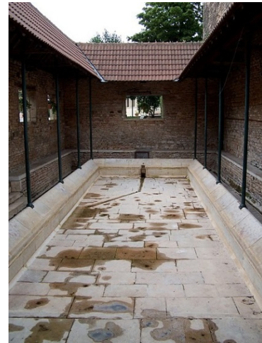
Figure 3. Lavoir de Saint-Gengoux-le-National