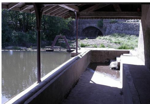
Figure 2. Lavoir de Chazelles (Cormatin)