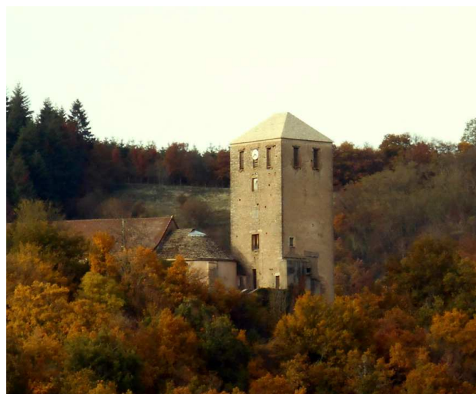
Les membres de CHÂTEAU-PATRIMOINE

*2) Les statuts de l'association CHATEAU-PATRIMOINE ainsi que la composition de son conseil d'administration et de son bureau peuvent être consultés à la Mairie de Château ou sur son site internet ( www.mairiedechateau.fr ).