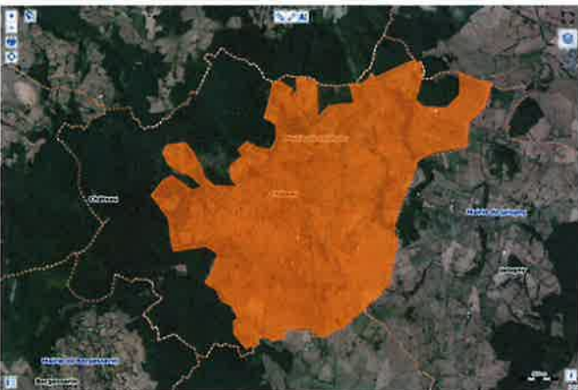
Solaire thermique en toiture