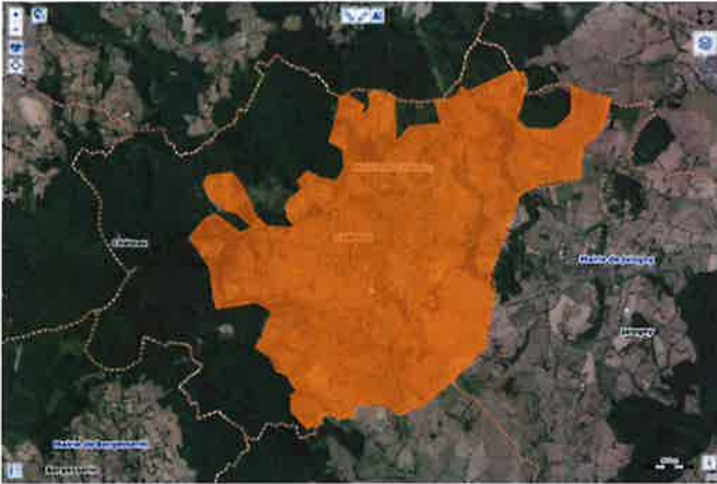
Solaire photovoltaïque en toiture